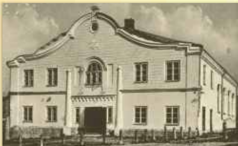
"Beth Midrash" žydų sinagoga

No 4, SINAGOGOS STREET, Telsiai. The synagogue for the rich "Beth Midrash". The building was destroyed during the Soviet times.