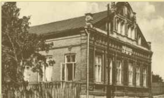
Telšių ješiva XX a. 4 deš.