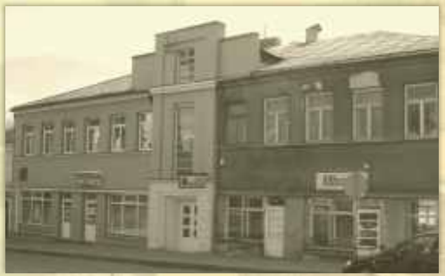
Respublikos g. 49, čia yra veikusi žydų mokykla.

STOTIES GATVĖ Nr.4, Telsiai. 1923 metais iš Kauno čia persikėlė žydų mokytojų seminarija „Javne“ - vienintelė tokio tipo mokykla visoje Lietuvoje.