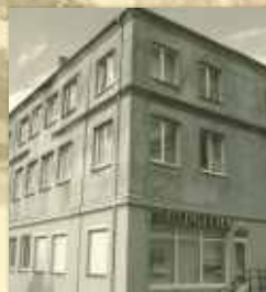
Buvę žydų maldos namai