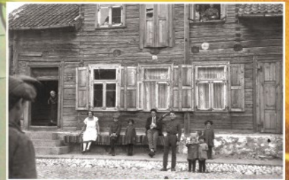
Tipiškas Žydų gyvenamasis namas