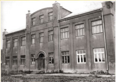
Vilkaviškio savivaldybės pastatas