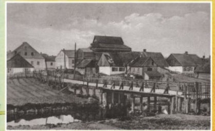
Eucharistinio kongreso tiltas