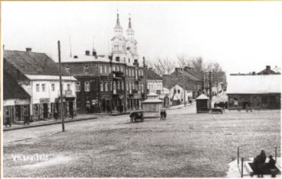
Pagrindinė Vilkaviškio gatvė