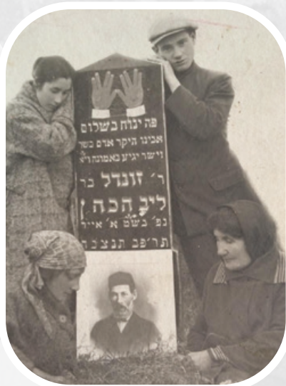
Paminklas šventikui Kaplanui

Raseiniuose buvo dvi žydų kapinės. Vienos – prie kalėjimo (dab. Raseinių krašto istorijos muziejus), o kitos – Vytauto Didžiojo g. gale, kur išlikusi „zomato“ (mūrinės tvoros) dalis. Vyresnieji prisimena prieš karą matydavę kapinėse stoviniuojančius, besimeldžiančius žydus. Kapinėse nebuvo gėlių, ant kapo dėdavo akmenėlius. Antkapių užrašuose būdavo nurodomas vardas, pavardė, tėvavardis ir net profesija. Kapinės sunaikintos sovietmečiu.