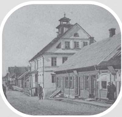
Senoji Vilniaus gatvė. Dešinėje Muzikansko limonadinė

Tarpukario metais Vilniaus g. stovėjo žydo Muzikansko limonadinė. Apie 1910 m. namo rūsyje atidaryta gazuoto vandens ir limonado pilstytuvė. Verslui klestinti, limonadinė buvo iškelta į pirmąjį namo aukštą ir veikė jame iki pat Antrojo pasaulinio karo. Šioje įmonėje dirbo du darbuotojai – vienas veždavo vandenį iš Magdės šulinio, kitas vietoje virė sirupą limonadui ir pilstė į stiklinius butelius.