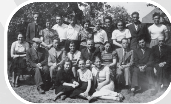
1939 m. žydų privatinės gimnazijos abiturientai ir mokytojai

Oficialiai Žydų gimnazija įkurta 1922 m., bet iš tikrųjų ji veikė jau nuo 1921 m. Pirmoji gimnazija įsikūrė visai šalia Muzikansko limonadinės esančiame name, Vilniaus gatvėje. Mokinių skaičius gimnazijoje svyravo nuo 50 iki 200 mokinių. 1935 m. atidaryta nauja Žydų gimnazija, iki tol mokykla veikė nuomojamose patalpose.