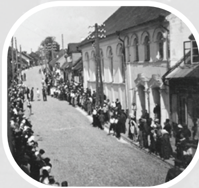
Didžioji sinagoga Maironio g. 1940 m.

Iki Antrojo pasaulinio karo Raseinių mieste būta 8 sinagogų. Toks skaičius pateisina teiginį, kad Raseiniai – „Žemaitijos Jeruzalė“. Šioje vietoje stovėjo mūrinė Didžioji žydų sinagoga, subombarduota Antrojo pasaulinio karo metu. Greičiausiai pirmoji sinagoga buvo pastatyta šioje vietoje, miesto centre, po 1681 m. Jono III Sobieskio privilegijos Raseinių miesto žydams. Nuotraukose matoma Didžioji sinagoga atstatyta po gaisro apie 1870 m.