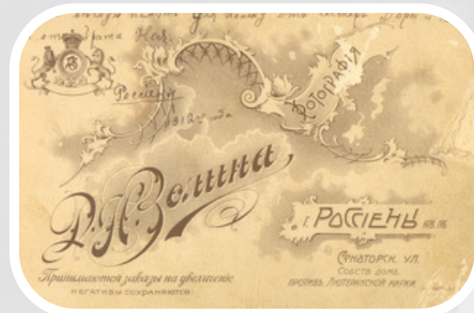
D. Zolino fotoateljė reklama

Apie D. Zolino dirbtuves pasakojama: jis nefotografuodavo esant dirbtiniam apšvietimui, turėjo savo stiklinį paviljoną, per kurį patekdavo natūrali šviesa. Fotoateljė dekoracijos vaizduodavo gamtą, puošnius interjerus.